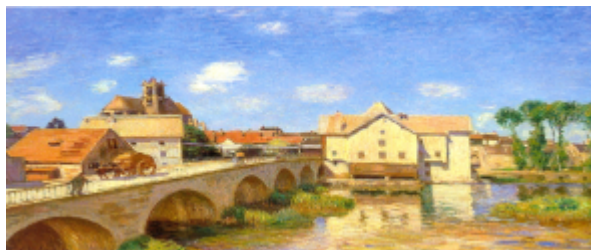
Collège Alfred Sisley